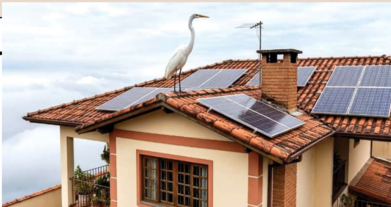
A garça branca associada a presságios fúnebres, melancólicos em contextos literários