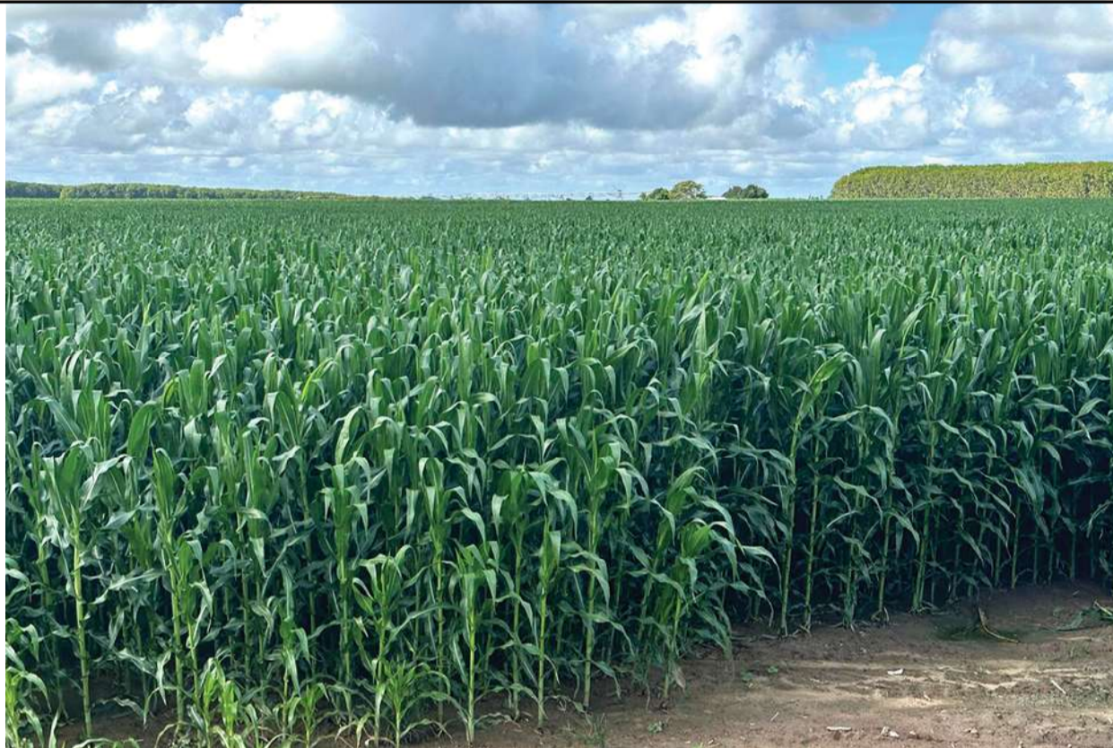
O milho consolidou-se como um dos principais produtos da pauta de exportação do AGRO brasileiro. Em 2025, foram exportados 40,98 milhões/toneladas.

Sou testemunha, trabalhava com Multiplicação, Inspeção e Certificação de Campos Sementes em Minas Gerais nesta época - início de 1975 - acompanhei de perto o avanço do agro moderno sobre essas áreas que antes eram consideradas marginais.