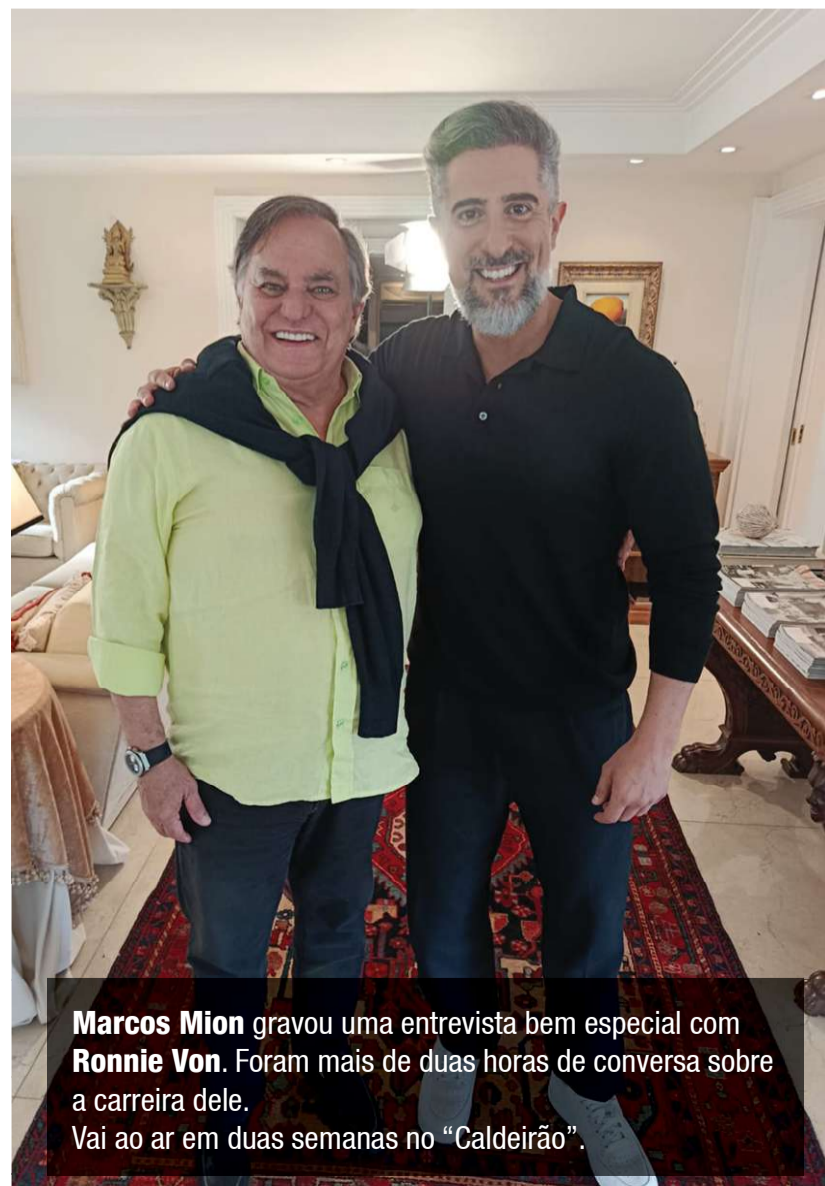
Marcos Mion gravou uma entrevista bem especial com Ronnie Von. Foram mais de duas horas de conversa sobre a carreira dele. Vai ao ar em duas semanas no “Caldeirão”.