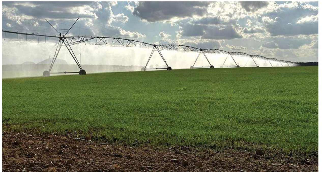
Pivô central de irrigação - um equipamento automatizado que permite baixa intervenção humana, boa uniformidade no controle da distribuição da lâmina d'água por aspersão