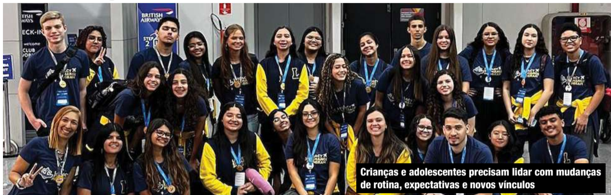
Crianças e adolescentes precisam lidar com mudanças de rotina, expectativas e novos vínculos

Com o fim das férias escolares, o retorno às aulas marca um período de readaptação importante para crianças e adolescentes não apenas no aspecto acadêmico, mas também emocional. Mudanças na rotina, novos professores, colegas e expectativas podem gerar ansiedade, insegurança e até resistência nos primeiros dias de aula.