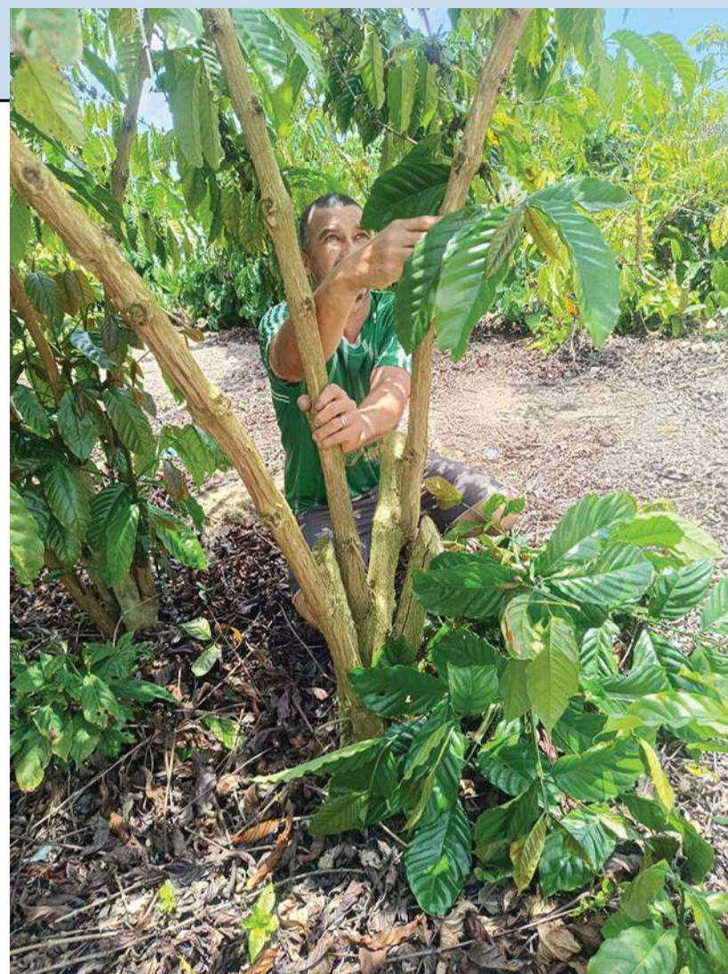
Desbrota *manual* de saia do cafeeiro conilon - retirada de brotos indesejáveis na base da planta - para direcionar a energia para os ramos produtivos