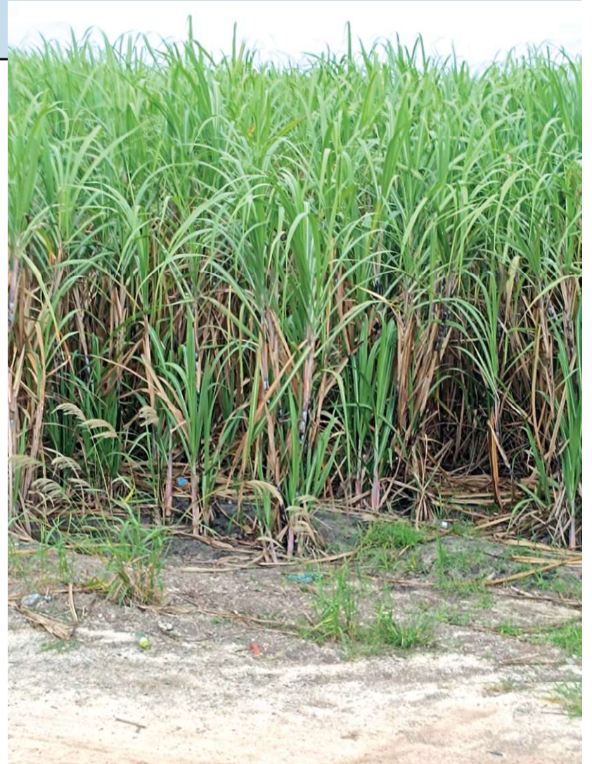
Canavial para usina de álcool no município de Conceição da Barra, ES. A cana-de-açúcar é matéria-prima para produção de açúcar e etanol combustível