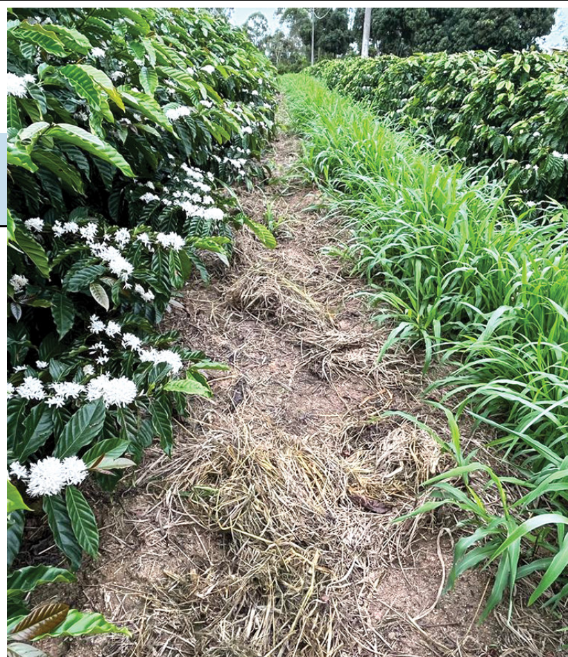
* Palhada residual de Brachiaria ruziziensis (roçada) e seu uso como cobertura de solo no sítio Franciscano.*

ção as entrelinhas com a Brachiaria ruziziensis . Este cuidado têm fortes embasamentos técnicos. A exposição da superfície do solo à radiação solar incidente, principalmente no verão, é extremamente danosa, com reflexos negativos nas características físicas, químicas e biológicas do solo. Quando a temperatura do solo ultrapassa 28º, a absorção radicular reduz-se drasticamente e a micro-