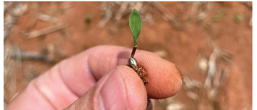
Semente advanced após 5 dias do plantio

Outra questão importante levantada pelo profissional é a do controle de plantas daninhas, quando a área estiver em nível alto de degradação. “Se estiver tomada pelas invasoras, antes de gradagem, nivelamento, é necessário dessecar as daninhas, às vezes duas, ou até três dessecações, a depender da intensidade”, explica.