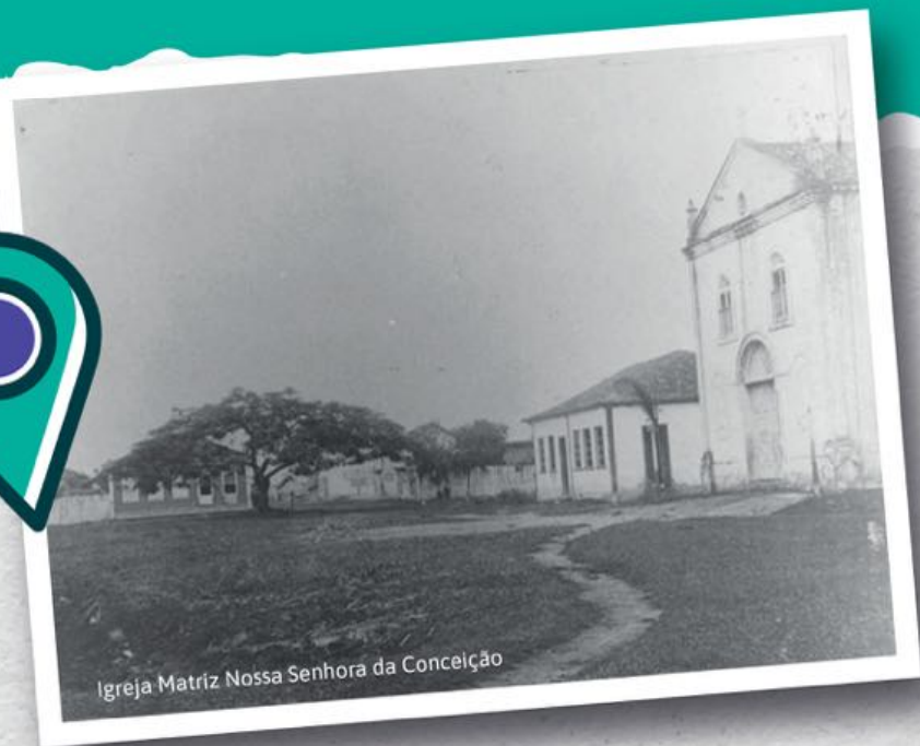
Igreja Matriz Nossa Senhora da Conceição