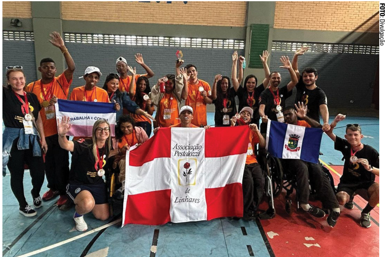
Os treinadores com os alunos

Ressalte-se ainda, que outras delegações do Espírito Santo também se fizeram participar dessa importante competição e foram elas: Associação Pestalozzi de Santa Teresa, Jaguaré, Itarana, Águia Branca e Porto Belo